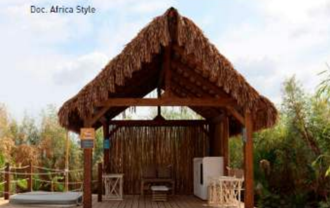
Doc. Africa Style

↑ Cabana of wonders è la struttura in legno massiccio con tetto sagomato e rivestito con l'innovativa tegola in materiale sintetico ShadySynth (foglia di palma da cocco), le foglie sono state progettate per il massimo effetto naturale sia in termini di variante colore, sia di torsione, regalando alla copertura l'inconfondibile effetto "thatch" tipico dei luoghi di vacanza ( africastyle.it )