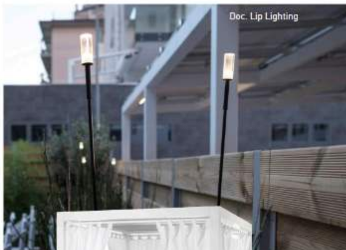
Doc. Lip Lighting

↘ Astro è il corpo illuminante da esterno a LED collegato a un'asta fine disponibile in altezze differenti e in due materiali che permettono un effetto diverso: una versione in alluminio per avere l'asta rigida e una in fibra di carbonio Alutex 202T per dare flessibilità al prodotto e renderlo quindi ondulante in presenza di vento ( www.liplighting.com )